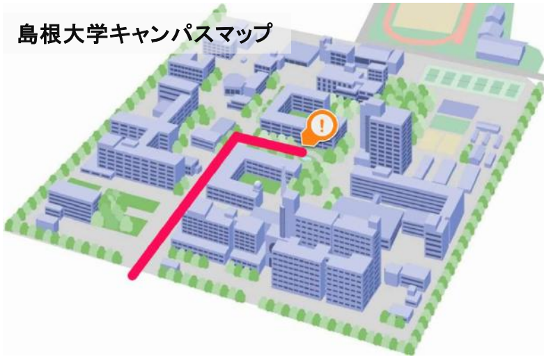
島根大学キャンパスマップ